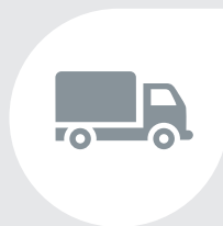
Métiers du transport, travaux publics et de l'agriculture