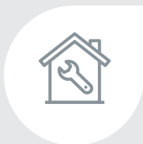
Métiers de la maintenance et administration