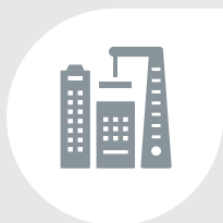
Métiers du bâtiment

Vous venez d'horizons professionnels différents. Nous mettons tout en œuvre pour vous proposer les solutions adaptées à vos besoins spécifiques.