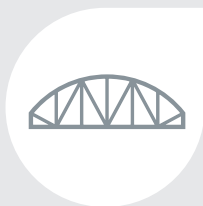
Métiers du métal