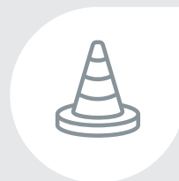
Métiers du chantier