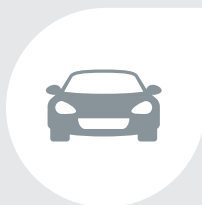
Métiers de l'automobile