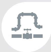
Métiers des installateurs